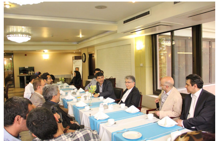
بازدید از شرکت تکتا

از وی در جشن هشتادمین سالگرد تاسیس دانشکده فنی دانشگاه تهران در سال ۱۳۸۳ به عنوان یکی از هفتاد نفر برگزیده خانواده فنی تجلیل به عمل آمد.