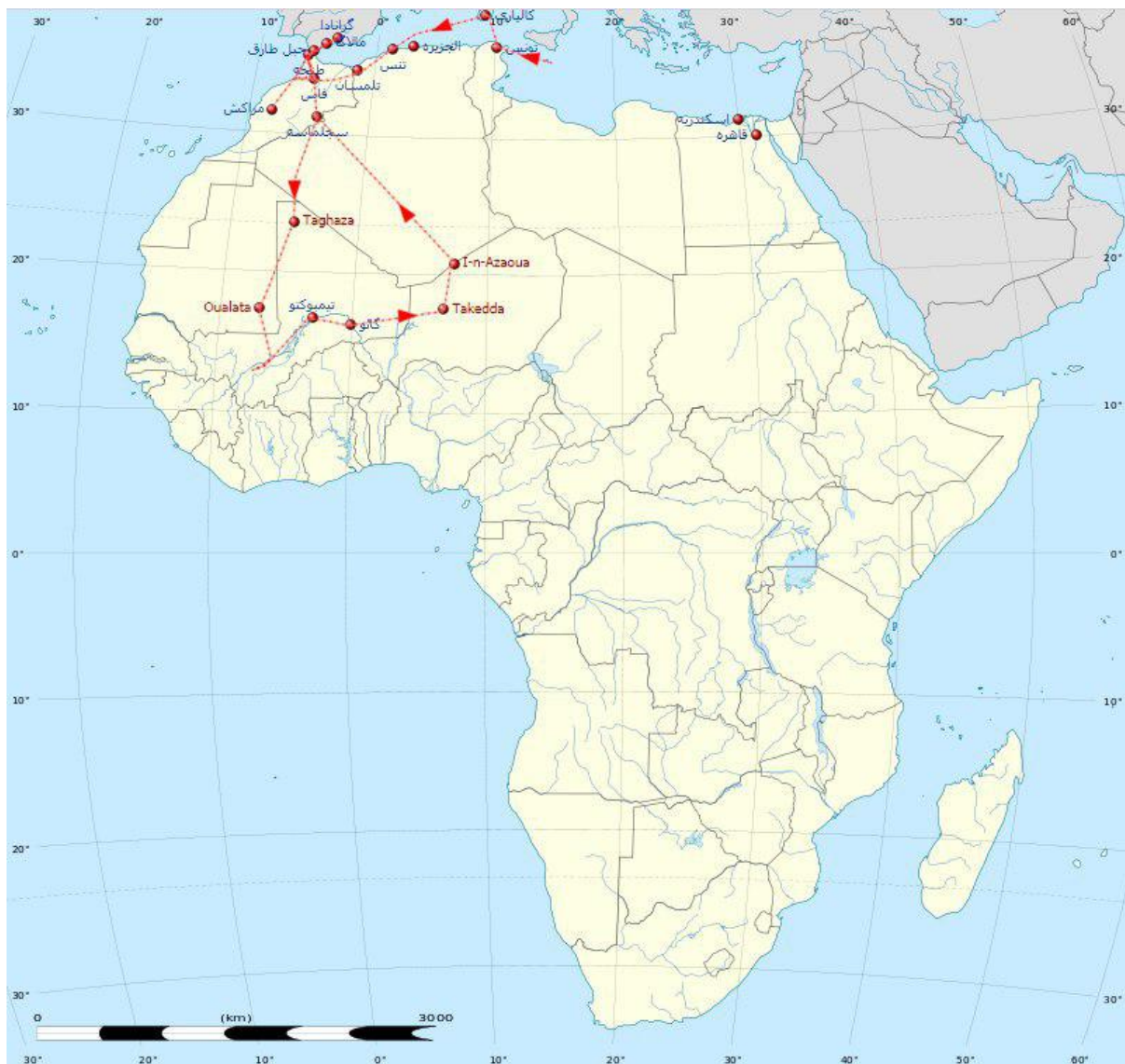
شکل سوم: سفر شش ساله

از ویژگی‌های بارز و وجوه تمایز این سفرنامه می‌توان به موارد زیر اشاره نمود: