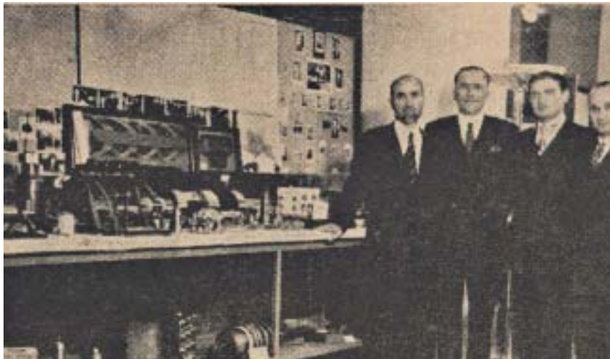
غرفه مهندسين دانشکده در بنگاه راه آهن

این جشن‌ها یک مرتبه در سال تحصیلی ۲۸-۱۳۲۷ (عصر روز پنجشنبه ۲۵/۱/۲۸) و دیگری در سال تحصیلی ۲۹-۱۳۲۸ (عصر روز پنجشنبه ۲۷/۲/۲۹) با حضور جمعی از آقایان وزیران و نمایندگان مجلس شورای ملی و سنا - رئیس و استادان دانشگاه - مهندسين - بازرگانان و سایر رجال برپا گردیده و در یک محیط صمیمانه گرمی از طرف استادان و کارمندان دانشکده از آنها پذیرائی بعمل آمد دانشکده فنی از آن جهت مبادرت بچنین عملی کرد که ضمن تشویق و ارائه زحمات دانشجویان و استادان رفع اشتباه از کسانی که تصور می‌کنند دانشگاه تهران مهندس نظری تربیت می‌نماید بشود.