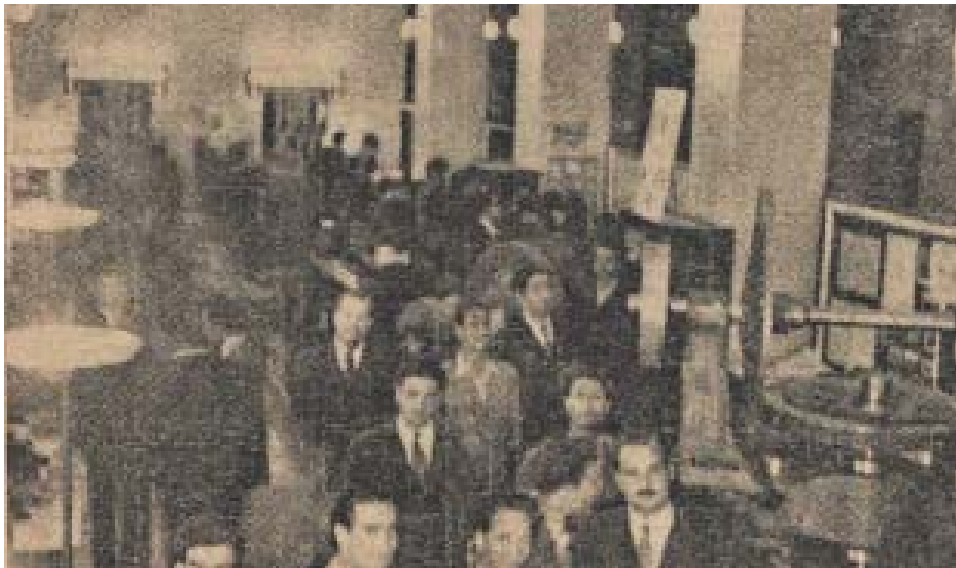
منظره عمومی نمایشگاه عملیات دانشجویان

سپس رئیس دانشکده از حضار تشکر نموده اظهار داشتند خوشبختانه دانشکده فنی مورد استقبال و علاقه کامل جامعه بوده همکاری صمیمانه از همه طرف دریافت می دارد. پس از آن اشکالات مخصوص تعلیمات عالی را در ایران تشریح نموده نشان دادند که وظائف یک مدرسه مهندسی در ایران بمراتب از وظائف مدارس مشابه اروپا و آمریکا سنگین تر است زیرا که تنوع و توسعه صنعت در کشور ما بجائی نرسیده است که اشخاص بتوانند تخصص محدود معینی را برای خود برگزینند و اوضاع کشور چنین ایجاب می نماید که یک نفر مهندس مسئول دستگاه در عین آشنائی کامل بشعب فنی مختلف در انجام وظائف کارگران نیز نظارت نزدیک نماید بنابراین ما مجبوریم بدان دانشجویان خود هم تعلیمات نظری و فنی وسیعی بدهیم و هم تمرین های عملی متنوع در برنامه بگنجانیم. در خاتمه آقای مهندس بازرگان اظهار داشتند که آرزوی دانشگاهیان و دانشکده فنی این است که جامعه ایرانی ما را به عنوان یک دستگاه خدمت گذار مفید بشناسد و ما را بیشتر دوست بدارد و بمهندسین فارغ التحصیل کار بیشتر و مهمتر رجوع نمایند تا بتوانند استعداد و لیاقت ذاتی خود را بمنصه ظهور برساند و برای خدمت بکشور مجهز تر گردد.